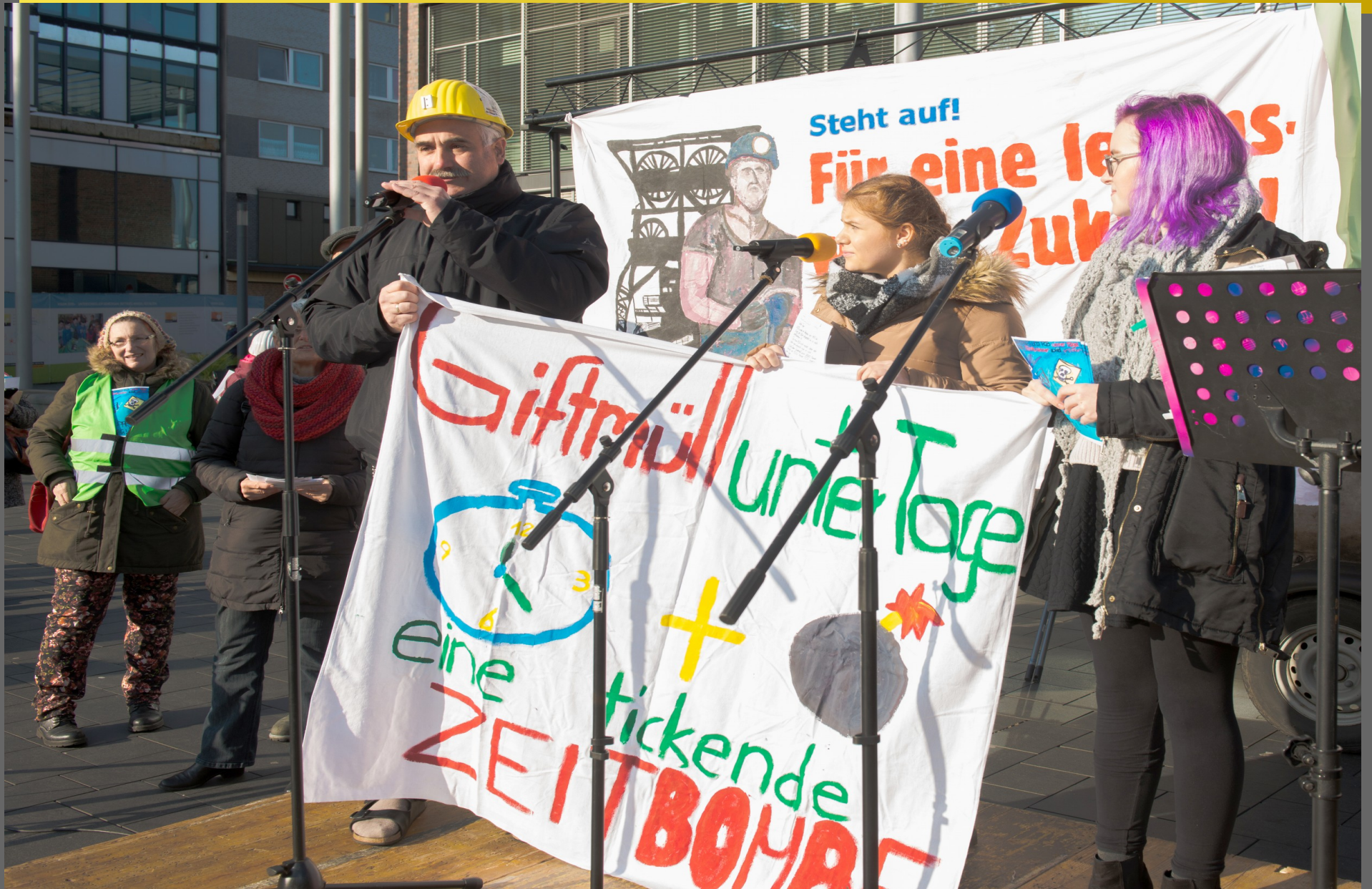
Demonstration gegen Giftmüll Unter Tage