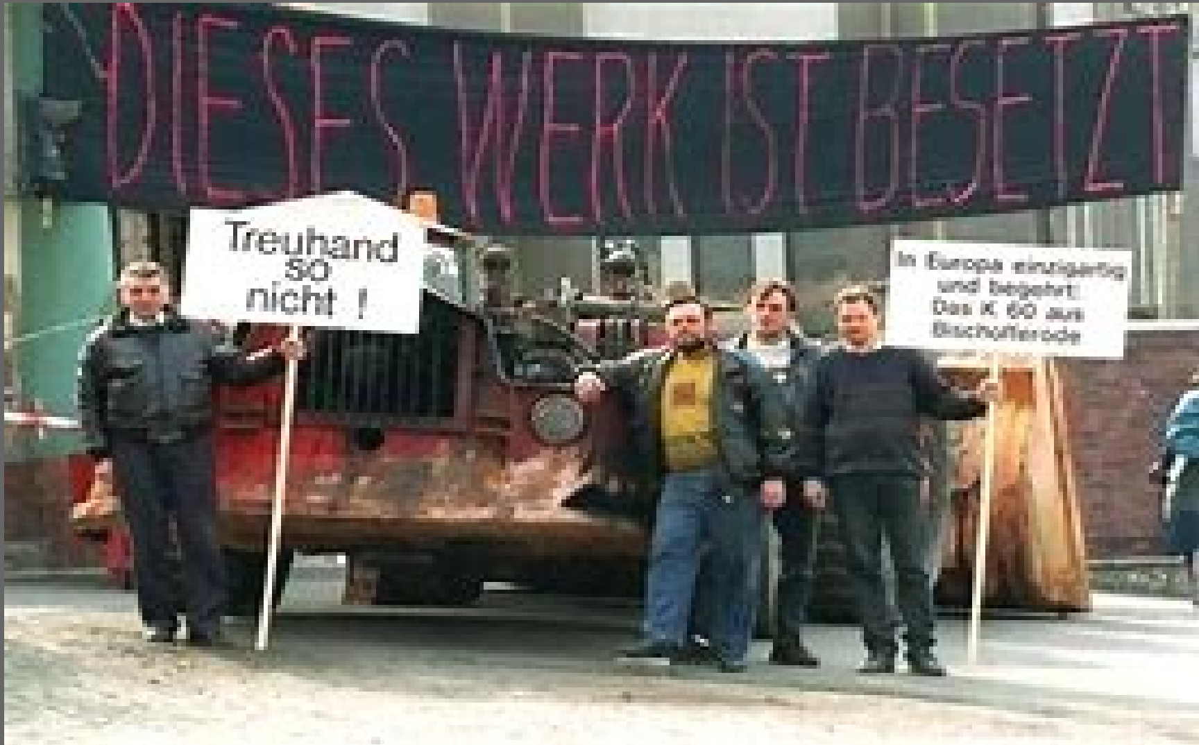
Besetzung des Kali Werkes Bischofferode