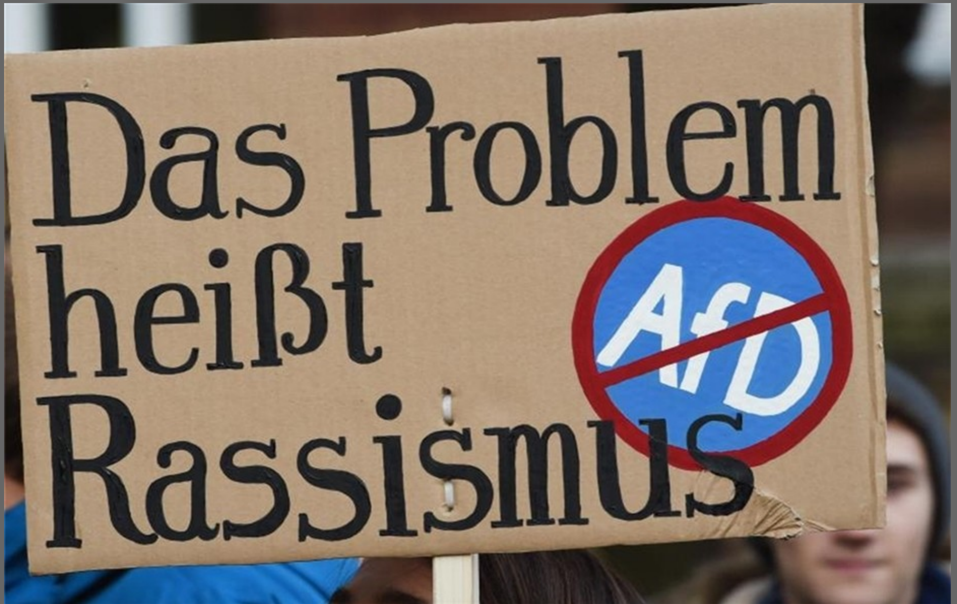
Demonstration gegen die AFD