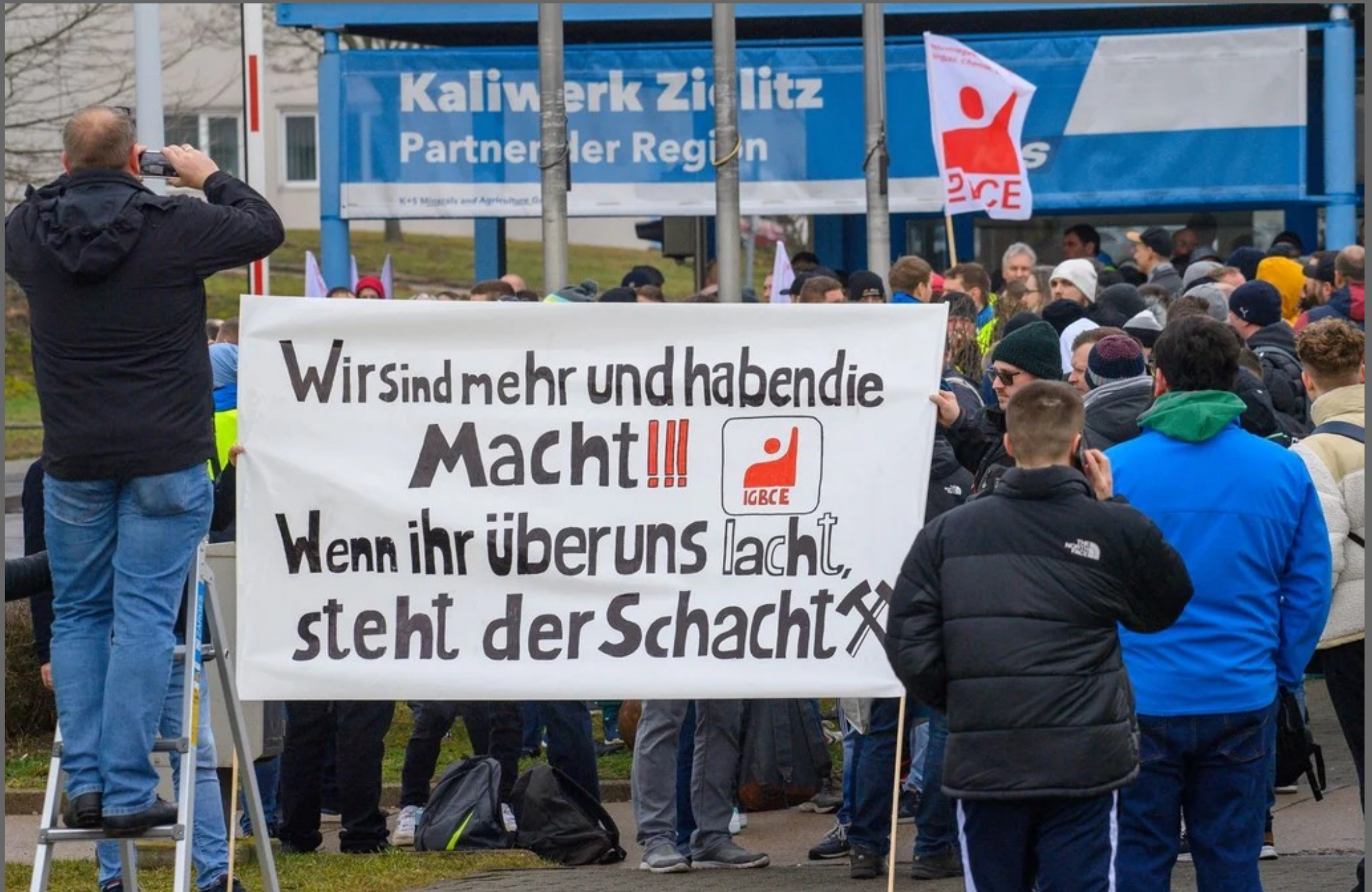
Kali und Salz Kollegen in Zielitz im Warnstreik 2023