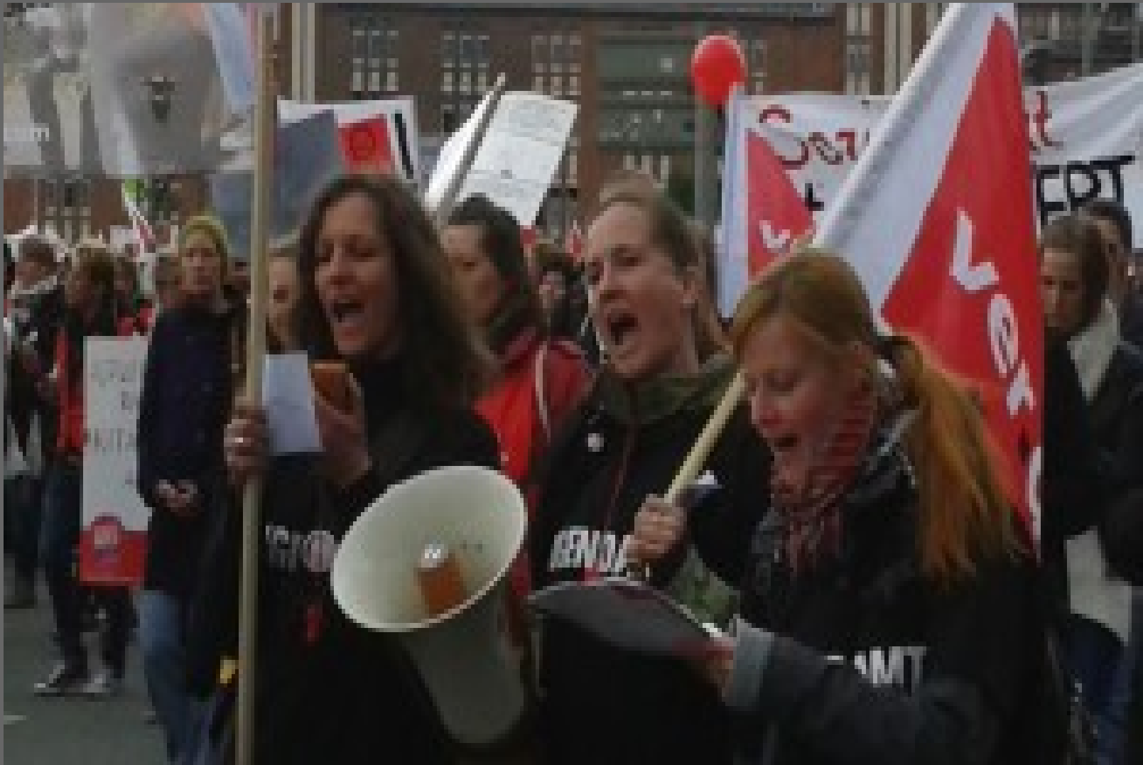
Verdi Streik 2023